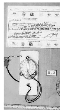
►► Muchas de las bombas neutralizadas tienen un sistema de relojería o temporizador que las activa para provocar la detonación.

Varias de ellas están bajo vigilancia policial de Carabineros. Los investigadores también creen que fabricaba las bombas para robar cajeros automáticos. ●